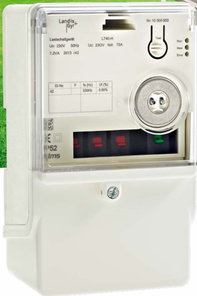
Landis+Gyr L740 Lastschaltgerät